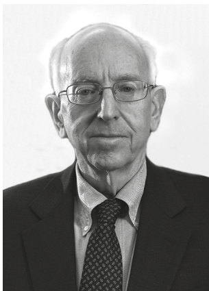
Познер Ричард Аллен, судья Апелляционного суда Соединенных Штатов в седьмом судебном округе Чикаго и старший преподаватель в школе права Чикагского университета

В настоящей работе, вышедшей в 1979 г., Ричард Познер впервые представил свою оригинальную теорию права — теорию максимизации благосостояния. Работа состоит из нескольких частей. В первой части работы рассматриваются несколько предварительных проблем, в том числе различие между позитивным и нормативным анализом и установление критерия предпочтения между этическими теориями. Вторая часть, которую Ричард Познер считает главной, посвящена различиям между утилитаризмом и максимизацией благосостояния как нормативных систем, а также краткому рассмотрению кантовского подхода. Судья Познер делает акцент на том, что разница между способностью к получению удовольствия и производительным трудом на благо окружающих является ключом к различению утилитаризма и максимизации благосостояния как этических систем. Также в статье имеются четыре приложения, в которых рассматриваются некоторые нормативные споры о праве с точки зрения экономического анализа, тщательно отделяемого автором от утилитаризма. В частности, Познер подробно анализирует проблему смертной казни, право на неприкосновенность частной жизни, вопросы личных свобод, рыночный подход к усыновлению детей и приобретению донорских органов.